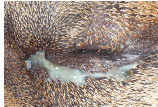
Sévère entropion chez un Shar Pei

Ainsi, il est recommandé chez les jeunes chiots de placer des sutures (fils de traction) temporaires sur les paupières pour une période de 3 à 6 semaines, pour éviter que celles-ci ne s'enroulent en frottant contre la cornée.