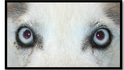
Alaskan Husky, 3ans, diabétique qui a retrouvé la vue après une chirurgie des yeux.